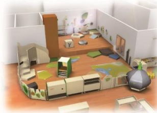
* 乳幼児エリア イメージ図

ごっこ遊びや積木遊び、鏡のトンネル等 日本初上陸の HABA 社 grow up シリーズ