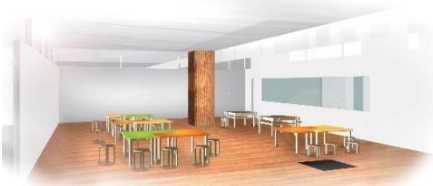
* ワークラボイメージ図