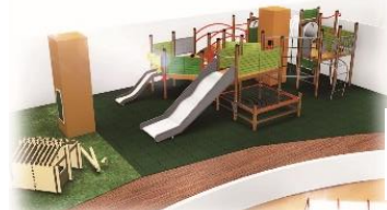
* アスレチック エリア イメージ図